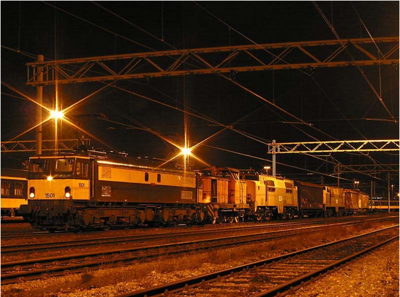
Het slooptransport na aankomst te Maastricht.

Omdat - zoals gezegd - ACTS de 1208 vrijwel leeg geplukt heeft, is destijds een afspraak gemaakt dat ACTS aan de werkgroep een loc met vergelijkbare inhoud moest teruggeven. Aldus is in hetzelfde weekend lok 1253 van ACTS overgedragen. De 1253 is nu de "nieuwe" plukloc.